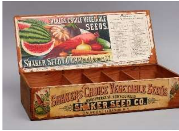
28 Saatgutkiste, Mount Lebanon, New York, ca. 1880