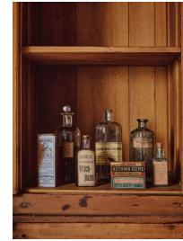
30 Diverse Medizinflaschen, Mount Lebanon, New York, ca. 1880