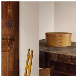
34 Key Visual »Die Shaker. Weltenbauer und Gestalter« © Vitra Design Museum, Graphikdesign: Matt Kay, A Practice For Everyday Life auf Grundlage von Fotos von Alex Lesage