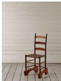
31 Modifizierter Webstuhl, Sabbathday Lake, Maine, ca. 1875-99