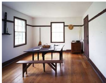
32 Shaker Village of Pleasant Hill, Kentucky