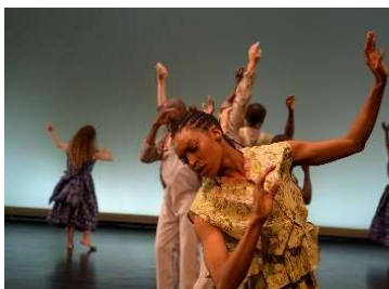
11 Fist and Heel Performance Group, »POWER«, 2024