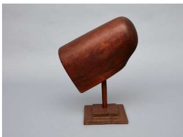
20 Haubenform, North Family, Mount Lebanon, New York, 1860 Shaker Museum, Chatham, New York