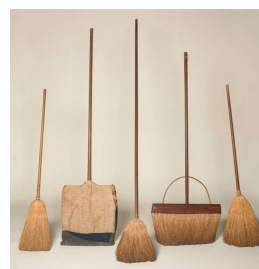
27 Besen, Mount Lebanon, New York Shaker Museum, Chatham, New York