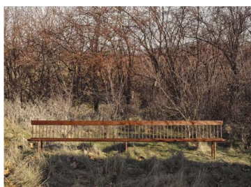
13 Sitzbank, Canterbury oder Enfield, New Hampshire, ca. 1855