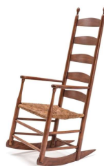
23 Schaukelstuhl, Mount Lebanon, New York, ca. 1850-70