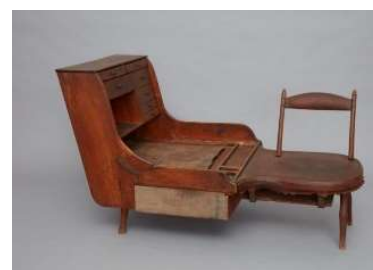
24 Schusterbank, Mount Lebanon, New York, ca. 1845 Shaker Museum, Chatham, New York