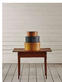
16 Verschiedene Spanschachteln