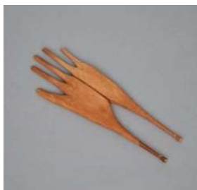
19 Handschuhform, Hancock, Massachusetts, 1880er Shaker Museum, Chatham, New York