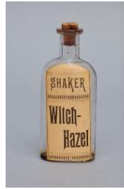
29 Medizinflasche „Hamamelis-Extrakt“, Canterbury, New Hampshire, 1920 Shaker Museum, Chatham, New York