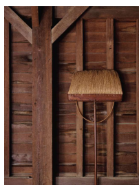
26 Polierbesen, New Lebanon, New York, 2024