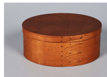
18 Spanschachtel, Mount Lebanon, New York, 1860 Shaker Museum, Chatham, New York