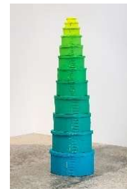
33 Amie Cunat, »Stacked Boxes«, 2018