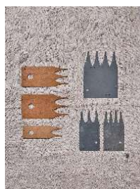
17 Holzschnittmuster für Spanschachteln