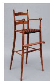
15 Hochstuhl, Mount Lebanon, New York, ca. 1880-83 Shaker Museum, Chatham, New York