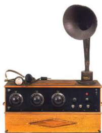
10 Radio, Canterbury, New Hampshire, ca. 1922-1923 Shaker Museum, Chatham, New York