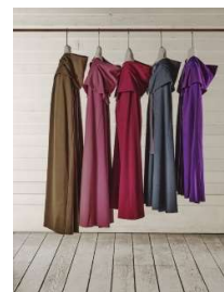
21 Umhänge aus Wolle