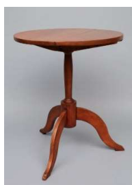
22 Beistelltisch, Mount Lebanon, New York, ca. 1820-50 Shaker Museum, Chatham, New York