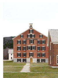
12 Dwellinghouse (1830), Hancock Shaker Village, Hancock, Massachusetts, 2024