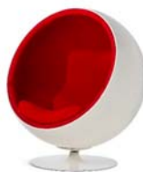
20 Eero Aarnio, Pallo / Ball Chair, Globe Chair, 1963