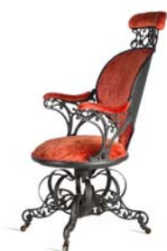
07 Thomas E. Warren, ohne Titel / Centripetal Spring Chair, 1849