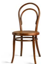
08 Michael Thonet, Nr. 14 / Consumsessel, 14er, ca. 1855-1859