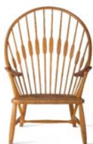
22 Hans J. Wegner, JH550 / Pfauenstuhl, 1947