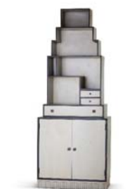
13 Paul Theodor Frank, Skyscraper Furniture, 1925