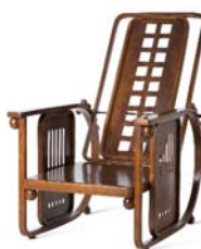
10 Josef Hoffmann, Nr. 670 / Sitzmaschine, 1905