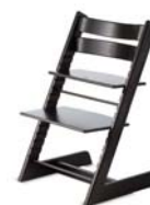
21 Peter Opsvik, Tripp Trapp, 1972