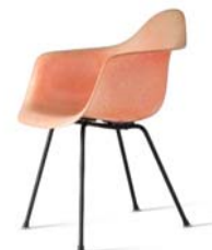
18 Charles und Ray Eames, DAX / Plastic Armchair, Fiberglas-Armlehnstuhl, 1948-1950