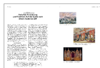
03 Beispielseite (Essay) aus »Atlas des Möbeldesigns« Grafik: Kobi Benezri Studio