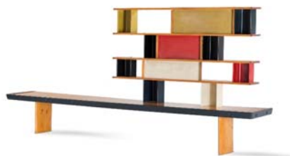
19 Charlotte Perriand, ohne Titel / Bibliothèque Tunisie, 1952