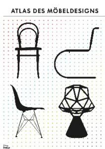
02 Cover »Atlas des Möbeldesigns« © Vitra Design Museum, Grafik: Kobi Benezri Studio