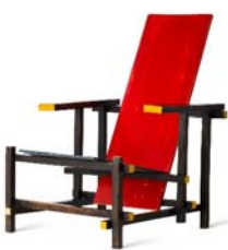
11 Gerrit Thomas Rietveld, ohne Titel / Rot- Blauer Stuhl (unbemalte Version), 1918/19 © Vitra Design Museum, Foto: Jürgen HANS, www.objektfotograf.ch © VG Bild-Kunst Bonn 2019