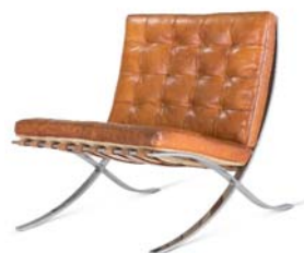
15 Ludwig Mies van der Rohe, MR 90 / Pavillonsessel, Barcelona Sessel, 1929