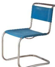
12 Mart Stam / Anton Lorenz, ST 12, 1929 © Vitra Design Museum, Foto: Jürgen HANS, www.objektfotograf.ch