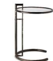
14 Eileen Gray, ohne Titel / E 1027 Side Table, ca. 1926/27