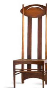
09 Charles Rennie Mackintosh, ohne Titel / Argyle Chair, 1897 © Vitra Design Museum, Foto: Jürgen HANS, www.objektfotograf.ch