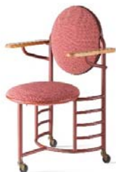
16 Frank Lloyd Wright, ohne Titel / Stuhl für das Johnson Wax Administration Building, 1936/37 © Vitra Design Museum, Foto: Jürgen HANS, www.objektfotograf.ch © VG Bild-Kunst Bonn 2019