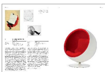
04 Beispielseite (Objekte) aus »Atlas des Möbeldesigns« © Vitra Design Museum, Grafik: Kobi Benezri Studio