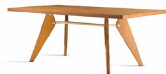
23 Jean Prouvé, S.A.M. No. 502, 1951 © Vitra Design Museum, Foto: Jürgen HANS, www.objektfotograf.ch © VG Bild-Kunst Bonn 2019