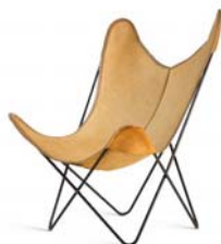
17 Grupo Austral (Antonio Bonet, Juan Kurchan, Jorge Ferrari Hardoy), B.K.F. Chair / Hardoy Chair, Butterfly Chair, 1938