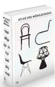
01 3D-Cover »Atlas des Möbeldesigns« © Vitra Design Museum, Grafik: Kobi Benezri Studio

Alle Bilder, deren Rechte durch die VG Bild-Kunst Bonn vertreten werden, können drei Monate vor der Ausstellung, sowie sechs Wochen nach Ende der Ausstellung kostenfrei und ausschließlich im Rahmen einer Berichterstattung (Print, Online, Social Media) über die Ausstellung in Deutschland verwendet werden. Die entsprechenden Copyright-Angaben sind dieser Bildübersicht zu entnehmen.