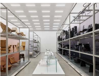
08 Installationsansicht »Colour Rush! Eine Installation von Sabine Marcelis, Vitra Schaudepot © Vitra Design Museum, Foto: Mark Niedermann © VG Bild-Kunst, Bonn 2022