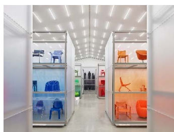
04 Installationsansicht »Colour Rush! Eine Installation von Sabine Marcelis, Vitra Schaudepot