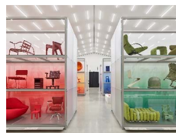
06 Installationsansicht »Colour Rush! Eine Installation von Sabine Marcelis, Vitra Schaudepot