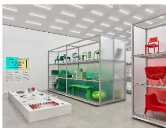
02 Installationsansicht »Colour Rush! Eine Installation von Sabine Marcelis, Vitra Schaudepot © VG Bild-Kunst, Bonn 2022