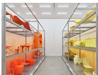
05 Installationsansicht »Colour Rush! Eine Installation von Sabine Marcelis, Vitra Schaudepot