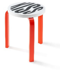
03 Barbara Kruger, Untitled (Kiss), Stool 60, 2019 (Design Alvar Aalto)