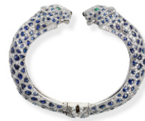
15 Panthère Armreif, Cartier Paris, 1958, Cartier Collection