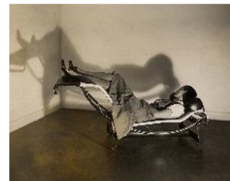
18 Charlotte Perriand auf der Chaise longue basculante, 1929 Perriand und Jeanneret