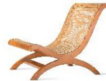
21 Clara Porset, Butaca, ca. 1948