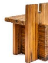
09 Lina Bo Bardi, Hocker für das Centre SESC Pompeia, São Paulo, 1979/80