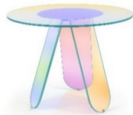
01 Patricia Urquiola, Shimmer, 2019