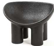
05 Faye Toogood, Roly Poly, 2018, © Vitra Design Museum, Foto: Andreas Sütterlin