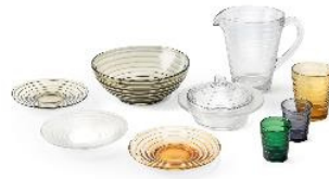
20 Aino Aalto, Glasserie Bölgeblick, 1932