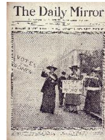
27 Zeitungsartikel über Suffragetten, die im Unterhaus protestierten, in: The Daily Mirror, London, 27. April 1906

Diese Bilder dürfen nur in Zusammenhang mit einer aktuellen Berichterstattung über die Ausstellung und mit der unten stehenden Bildunterschrift verwendet werden. Bilder in hoher Auflösung stehen zum Download verfügbar unter: www.design-museum.de/pressebilder . Alle Bilder, deren Rechte durch die VG Bild-Kunst Bonn vertreten werden, können drei Monate vor der Ausstellung, sowie sechs Wochen nach Ende der Ausstellung kostenfrei und ausschließlich im Rahmen einer Berichterstattung (Print, Online, Social Media) über die Ausstellung in Deutschland verwendet werden. Die entsprechenden Copyright-Angaben sind dieser Bildübersicht zu entnehmen