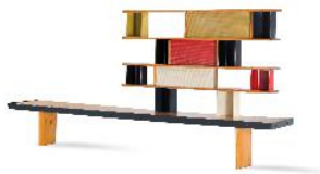
13 Charlotte Perriand, ohne Titel / Bibliothèque Tunisie, 1952 © Vitra Design Museum, Foto: Jürgen Hans, © VG Bild-Kunst, Bonn 2021