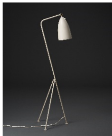
16 Greta Magnusson Grossman, Grasshopper, 1949/50