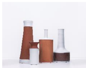
17 Hedwig Bollhagen, Vasen. Einzel- und Musterstücke, 1950er und 1960er Jahre