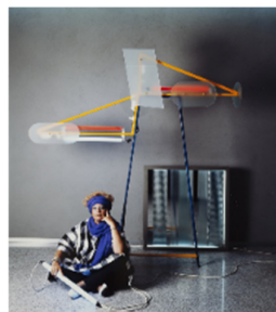
08 Nanda Vigo 1985 mit ihren Entwürfen Licht Tree (1984) und Cronotopo (1964)