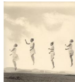
24 Lichtbildwerkstatt Loheland: Sprung (Montage), ca. 1930