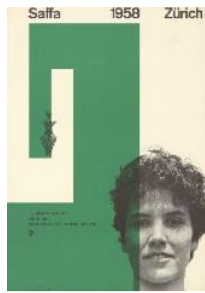
10 Plakat für die Schweizerische Ausstellung für Frauenarbeit, Saffa, Zürich, 1958, Gestaltung: Nelly Rudin Plakatsammlung Schule für Gestaltung Basel, Copyright für Nelly Rudin: © VG Bild-Kunst, Bonn 2021