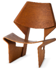
11 Grete Jalk, No. 9-1 / GJ Stuhl, 1963 © Vitra Design Museum, Foto: Jürgen Hans