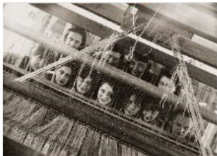
22 Leben am Bauhaus: Gruppenporträt der Weberinnen hinter dem Webstuhl in der Weberei des Bauhaus Dessau, 1928