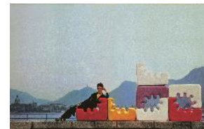
06 Werbeanzeige für Liisi Beckmanns Karelia-Sessel, 1969