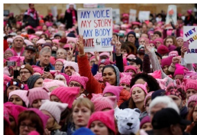
04 Demonstrierende auf dem Women's March in Washington D.C., 21. Januar 2017 picture alliance / Reuters | Shannon Stapleton (Dieses Pressebild darf nicht beschnitten, farblich verändert oder überschrieben werden.)