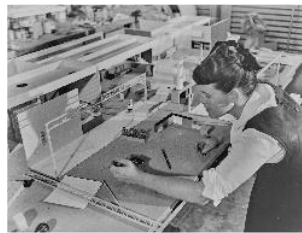
14 Ray Eames bei der Arbeit an einem Modell, 1950