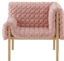
17 Inga Sempé, Ruché, 2010 © Ligne Roset