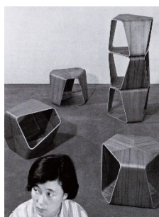
07 Reiko Tanabe in der Zeitschrift »Geijutsu Shincho«, August 1967