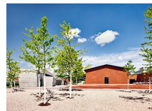
18 Außenansicht Vitra Schaudepot