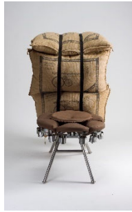
10 Gunjan Gupta, Old Bori Throne, 2008