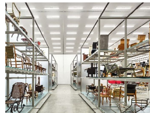
21 Innenansicht Vitra Schaudepot

Diese Bilder dürfen nur in Zusammenhang mit einer aktuellen Berichterstattung über die Ausstellung und mit der jeweiligen Bildunterschrift verwendet werden. Bilder in hoher Auflösung stehen zum Download verfügbar unter: www.design-museum.de/pressebilder .