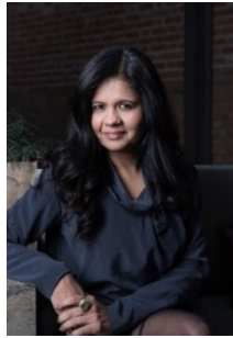
11 Gunjan Gupta © wrap Art & Design Pvt Ltd