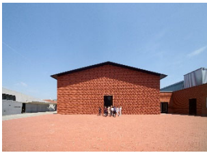
19 Außenansicht Vitra Schaudepot