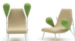
02 Matali Crasset, Extension de générosité, 2017, Foto: Ezio Prandini © VG Bild-Kunst, Bonn 2021