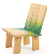
04 Raw-Edges, Herringbones Chair, 2016