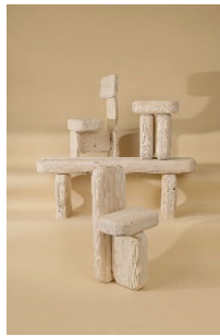
14 Lisa Ertel, Dune, 2017