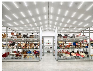
20 Innenansicht Vitra Schaudepot