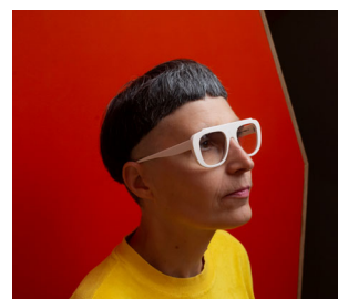
03 Matali Crasset Foto: Julien Carreyen & Valentine Jouanjus © VG Bild-Kunst, Bonn 2021