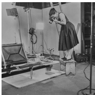
01 Ray Eames fotografiert das »Tandem Seating« im Eames Studio, 23.10.1962