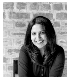
09 Khushnu Panthaki Hoof © Jessica Nair