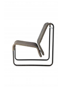
12 Maija-Liisa Komulainen, Sessel, 1951