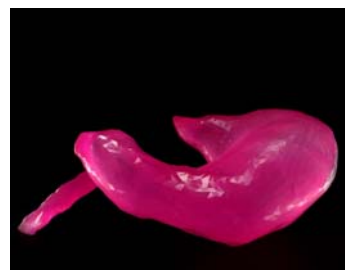
06 Alexandra Daisy Ginsberg, The Synthetic Kingdom, 2009 © Alexandra Daisy Ginsberg, Foto: Carole Suety