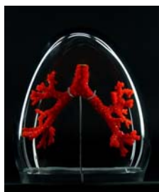
04 Alexandra Daisy Ginsberg, The Synthetic Kingdom, 2009