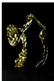
05 Alexandra Daisy Ginsberg, The Synthetic Kingdom, 2009 © Alexandra Daisy Ginsberg, Foto: Carole Suety