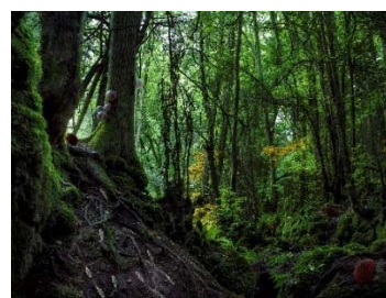
09 Alexandra Daisy Ginsberg, Designing for the Sixth Extinction, 2013-15 © Alexandra Daisy Ginsberg