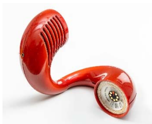
10 Panasonic Toot-a-Loop R-72S Radio, 1969–72