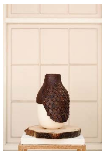
14 Studio Formafantasma, Botanica, im Auftrag der Plart Foundation, 2011; Foto: Luisa Zanzani