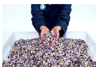
17 Precious Plastic, geschredderter Kunststoff

(Dieses Pressebild darf nicht beschnitten werden)