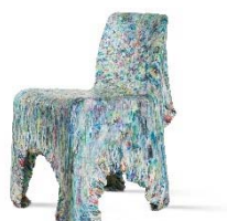
08 Bär+Knell, Müll Direkt, 1994 © Vitra Design Museum, Foto: Jürgen Hans