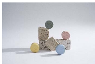
11 Shellworks, Kosmetikbehälter aus Vivomer, einem Biokunststoff, der mit Hilfe von Mikroben hergestellt wird, 2021