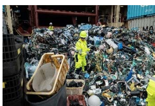
07 The Ocean Cleanup, Besatzung sortiert Plastik an Deck nach Müllbergung durch System 002, Oktober 2021