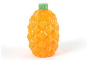
04 Edward Hack, Ananas-Sirupflasche, ca. 1958; Mit freundlicher Genehmigung von Museum of Design in Plastics, Arts University Bournemouth