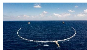
09 The Ocean Cleanup, System 002 im Einsatz für Tests im Great Pacific Garbage Patch, 2021