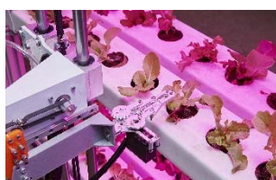
13 Marco Cagnoni, Plastic Culture / Vertical Bioplastic Farm, 2018; Foto: Nicole Marnati