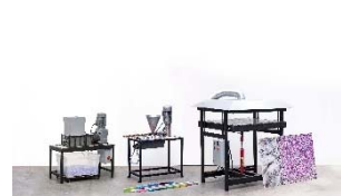
18 Precious Plastic Maschinen der Version 4 inklusive Schredder, Extruder und Plattenpresse

(Dieses Pressebild darf nicht beschnitten werden)