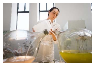
15 Klarenbeek & Dros in Zusammenarbeit mit Luma, Kunststoffproduktion auf Algenbasis; Foto: Antoine Raab, mit freundlicher Genehmigung von Luma