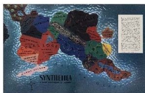
05 Karte von Synthetica, ein aus Kunststoffen bestehender Kontinent, veröffentlicht in »Fortune« Magazin, 22. Oktober 1940; Vitra Design Museum Archiv