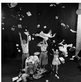
01 Foto von Peter Stackpole für einen Artikel über »Throwaway Living«, veröffentlicht in der Zeitschrift LIFE, 1. August 1955 © Getty / Foto: Peter Stackpole