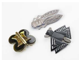
02 Maison Auguste Bonaz, Broschen aus Galalith und versilbertem Lucite, ca. 1920-1930