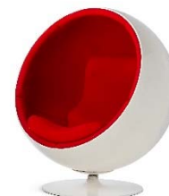
06 Eero Aarnio, Pallo / Ball Chair, Globe Chair, 1963