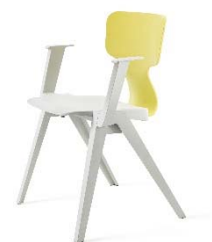
12 Ineke Hans, REX chair, 2021 © VG Bild-Kunst, Bonn 2021 / Vitra Design Museum, Foto: Andreas Sütterlin